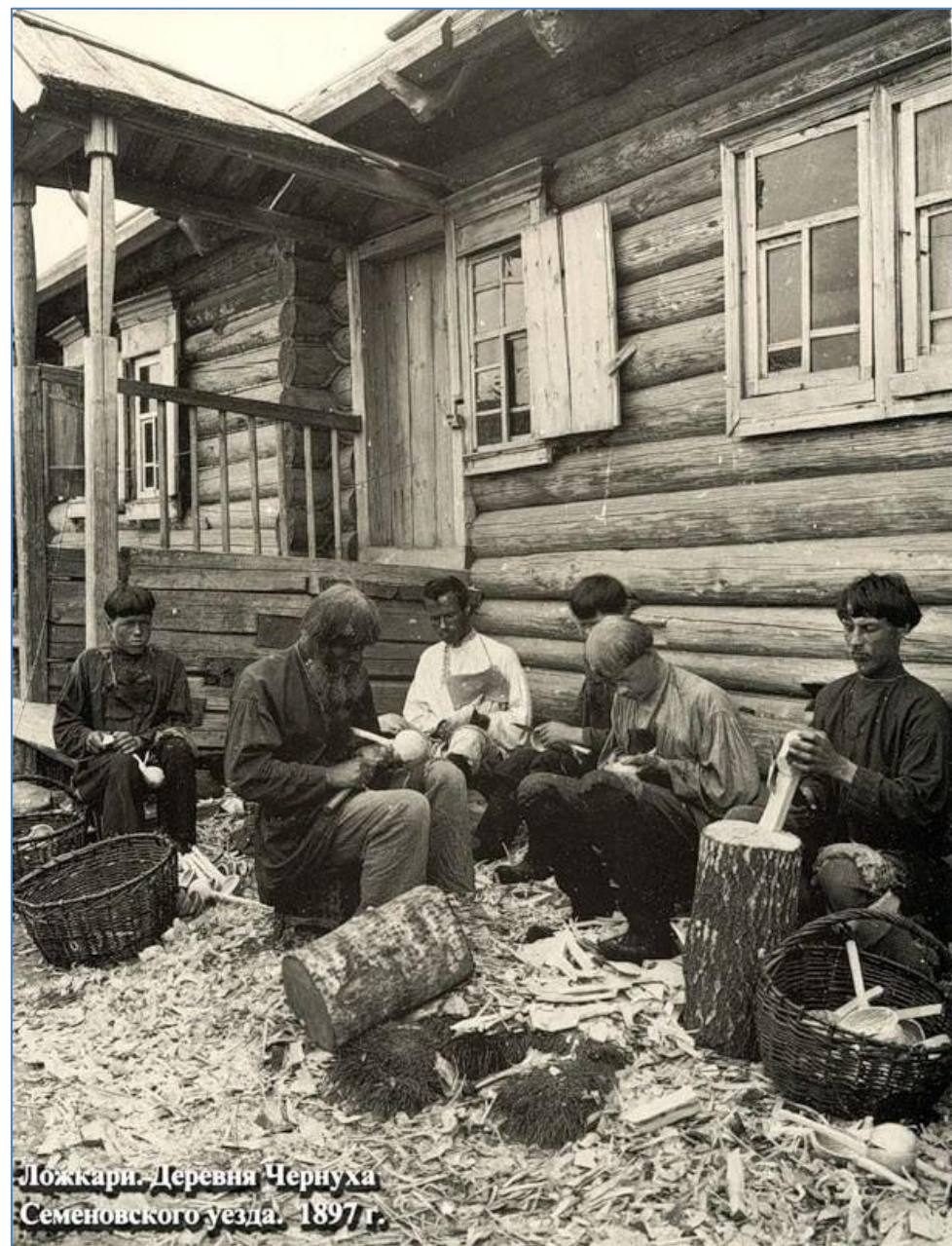
Ложкари. Деревня Чернуха Семеновского уезда. 1897 г.